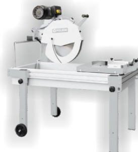
Sierra de Mármol y Cerámica