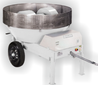
Mezclador de Mortero