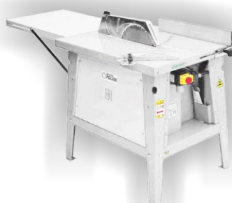
Sierra de Mesa para Carpintero