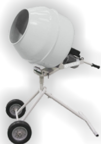
Mezclador de Concreto Serie Mini